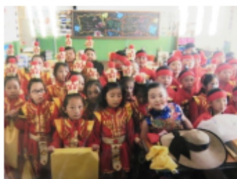
中国のクラスの友だち