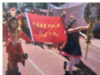
運動会入場での旗手

2人の保護者にご協力いただき、学校の写真を見せていただきました。日本の学校との違いについて、お話を聞きましたので、子どもたちに知らせ、より理解を深め合いたいと思ひます。