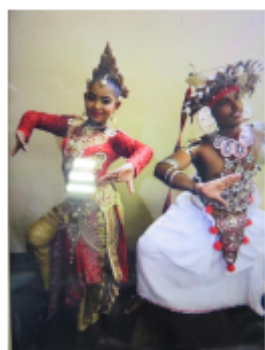
スリランカの踊り