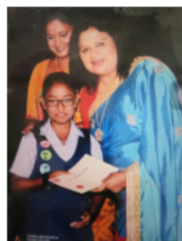
学校長からの表彰

青葉小の子どもたちも、すぐに仲良くなって、困っている時には手伝ったり助けたりしています。先生は、担任の先生以外にも、通級指導の先生、日本語指導の先生や中国語ボランティアの方、ALTやEAAなど英語がよく話せる先生たちにサポートしてもらおう体制をとって、2人の笑顔もだんだん多くなっているところです。